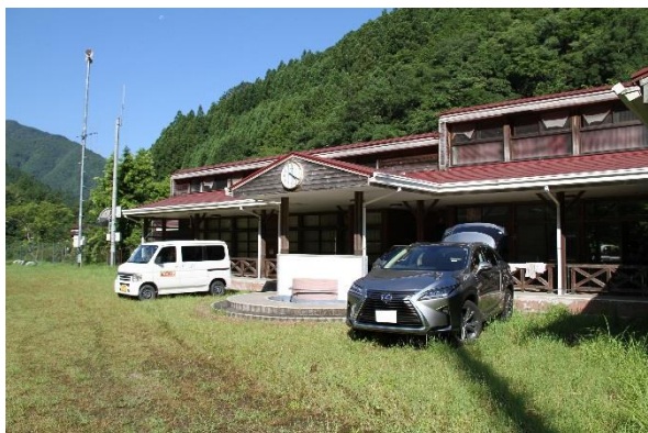
● 廃園になった幼稚園の教室