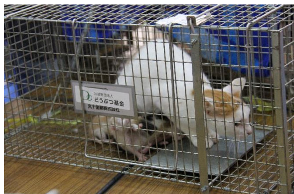
● 手術待ちの間に生まれた子猫たち