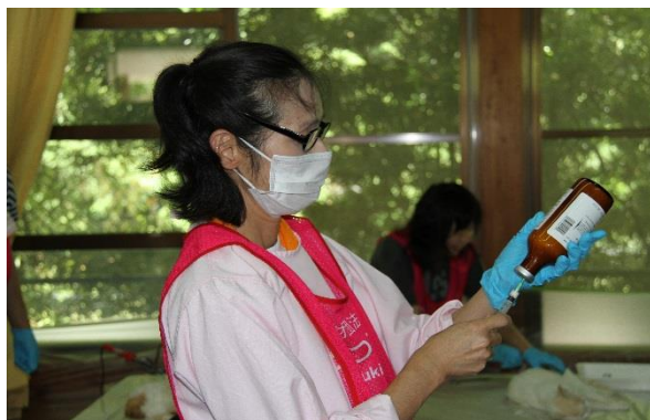
● 看護師の方にも協力頂きました