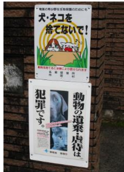
「奄美ノネコセンター」に続く入り口

生態系を守るために在来種（クロウサギ）が棲んでいる 森林内から外来種（猫）を排除する。「どれくらいの割合 まで減らす」という目標設定はなく、ゴールは「100%の 猫排除」なのである。もちろんこの「ノネコ管理計画」 ——ノネコの生息状況調査や個体数推定および捕獲等にか かる人件費、センサーカメラ・箱ワナなどの消耗品費など には、私たちの税金が使われているのだ。