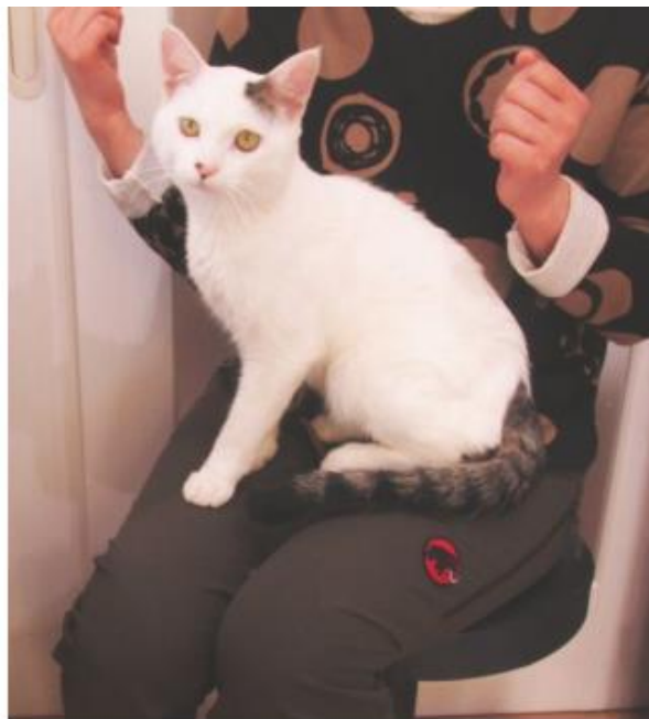
奄美大島で捕獲されたノネコ