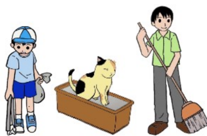
糞尿の管理と周辺の清掃をします