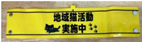
地域猫活動用腕章